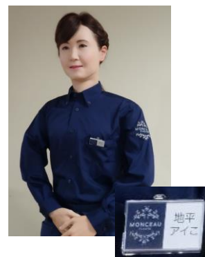
アンドロイド「地平アイコ」®さん