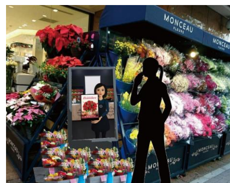
モンソーフルール銀座店 店頭 (マロニエゲート銀座 2/1F)

是非、モンソーフルール銀座店 (マロニエゲート銀座 2/1F) のエレーヌに会いに来てください!