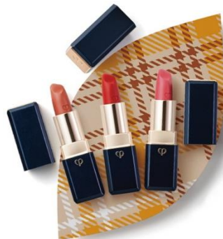
クレード・ポー ポーテ【MG2/1F】 ルージュアレーブル カシミア 税込 6,480 円