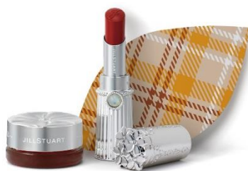
ジルステュアート【MG2/1F】 チーク&アイブロッサム 2,484 円 リップブロッサム ベルベット 税込 3,024 円