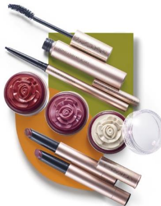
ファンケル ビューティ&ヘルス【MG2/1F】 ロングラッシュ マスカラ 税込 2,366 円 カラーフィット アイライナー 税込 1,620 円 クリーミィチーク 税込 2,268 円 クリーミィハイライト 税込 2,268 円 アクアセラム ルージュ 税込 3,132 円