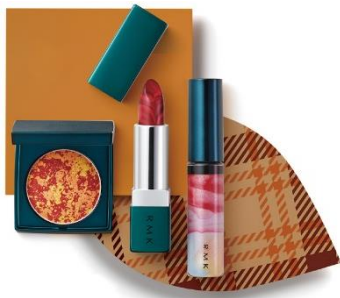
RMK【MG2/1F】 ミッドナイトフラワー ブラッシュ 税込 3,780 円 ミッドナイトフラワー リップスティック 税込 3,780 円 ミッドナイトフラワー リップグロス 税込 3,024 円