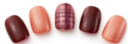
ディナート パイ スタンプネイル【MG2/3F】 デジタルネイルコース 税込 3,240 円