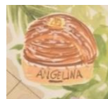
リースに描かれている、アンジェリーナのモンブラン