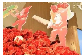
ハナドケイ上のドワーフ